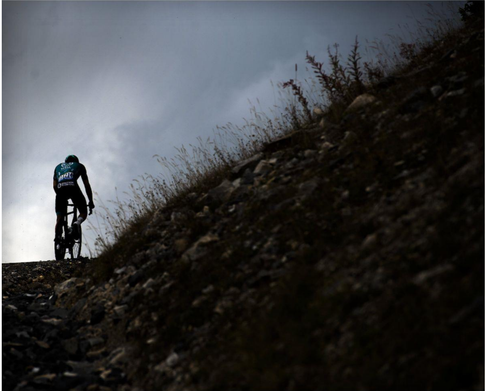
De 17de etappe: Jens Debusschere zwoegt zich op één van de allersteilste stukken tijdens de beklimming van de Col de la Loze omhoog. Hij zal als enige na ruim 42 minuten buiten de tijd binnenkomen en uit koers genomen worden. Einde Tour voor hem.