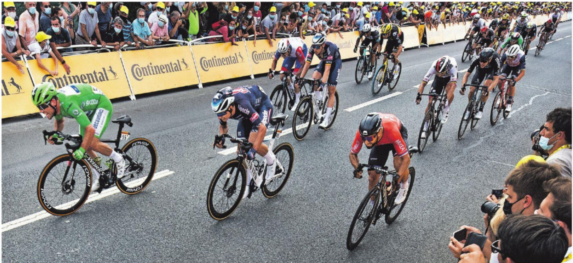
Mark Cavendish (links in de groene trui) is de sterkste in de sprint en wint opnieuw in Châteauroux.