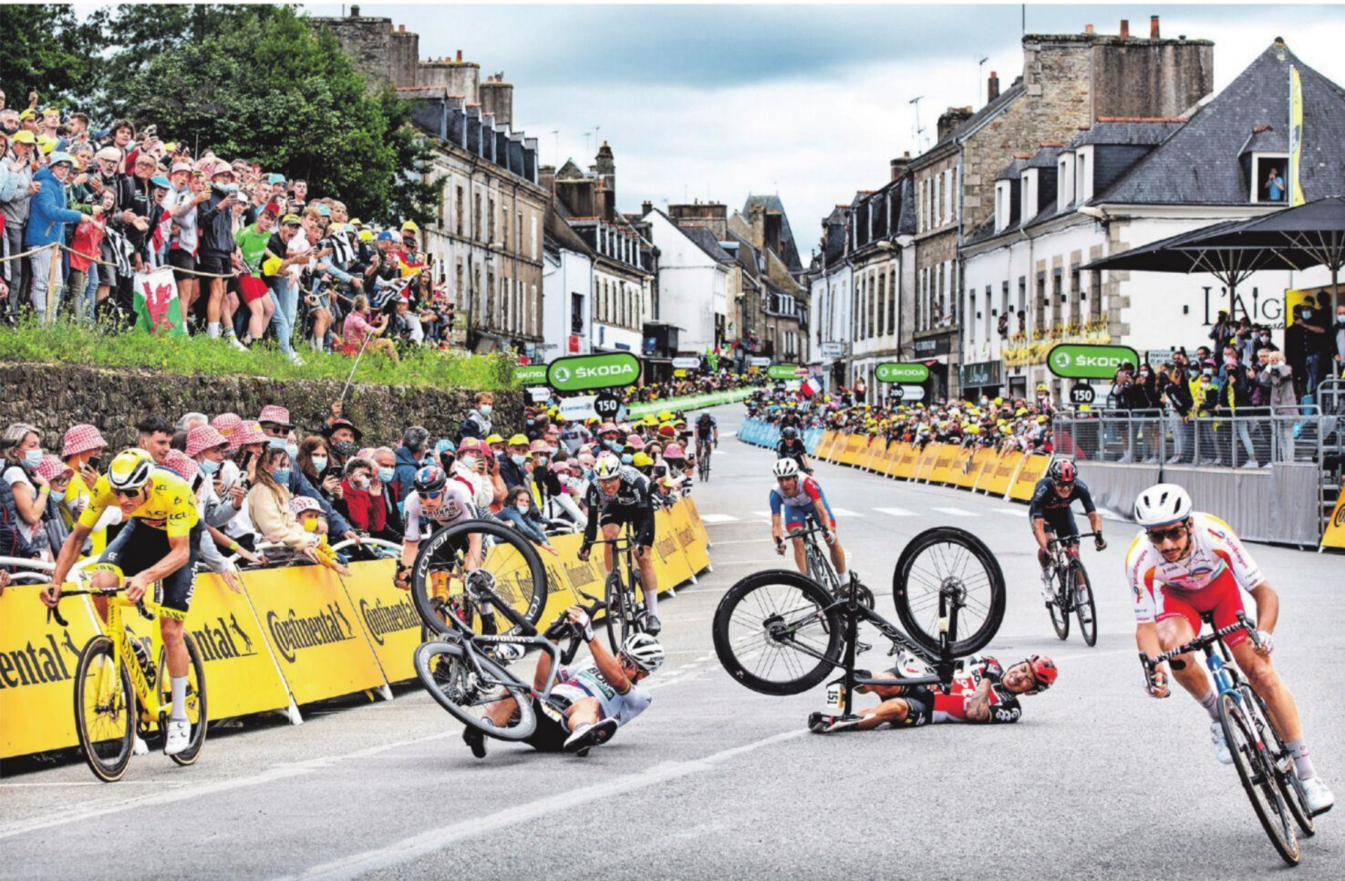
Op 100 meter voor de finish kan